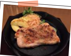
Grilled Chiken Steak 直火焼きのガッツリ道産チキンステーキ

Extra Meat ..... +¥333 (税込 360) 肉を追加 2倍！