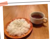
Rice and Soup Set

Rice, Soup and Salad Set ライスとスープ サラダのセット