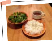
Rice, Soup and Salad Set

Rice, Soup and Salad Set ライスとスープ サラダのセット