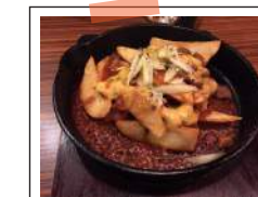
Chilli Cheese Fries 自家製アメリカンチリチーズのポテト