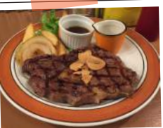
JVB Style Beef Steak ジャクソン風 豪快ビーフステーキ

JVB Style American Beef Steak Burger +¥92 (税込 100) ジャクソン風 豪快ビーフステーキバーガー