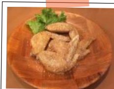
4pc. Buffalo Wings 手羽先揚げ (4ピース) ハーブ塩

Extra Wing ..... +¥120 (税込 130) 追加手羽 (1本あたり) ※4ピース以上で追加する場合